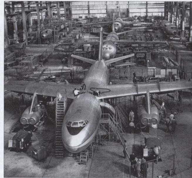
Das erste zivile Strahlverkehrsflugzeug Deutschlands entstand in der Halle 222; im Bild die Montage der Maschinen vom Typ 152/II, vorm die 152 V-4

Und nun schauen Sie noch einmal auf die einstige Halle 219, eine dieser Industriebau-Schönheiten, die nach der Wende zum neuen Terminal des Flughafens Dresden international umgebaut wurde.